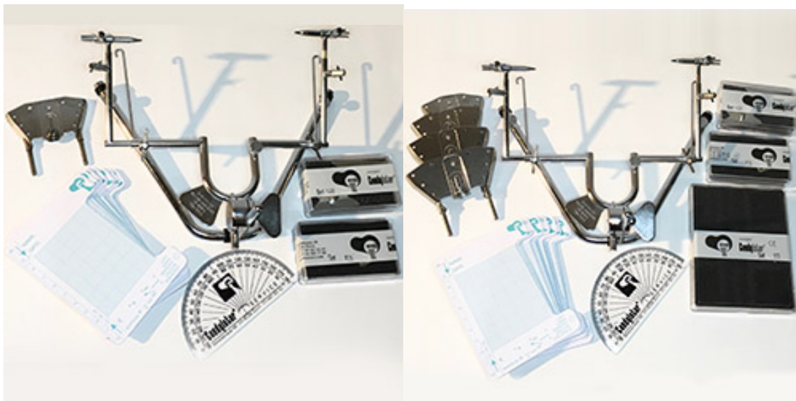
Une partie du matériel mis a disposition lors des stages

Formations Thierry Supplie -Code APE 8559A -N° SIRET 897 794 202 00019 Siège social 14 bis avenue des fougères 77340 pontault-Combault Tel: 0160285632 Port: 0632015632 Email: admin@france-denturiste.fr Site: www.france-denturiste.fr